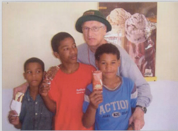
Mes « shoeshine boys ». Je les vois régulièrement pour pratiquer mon espagnol.