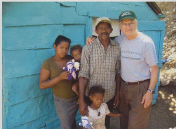
Avec les familles pauvres.