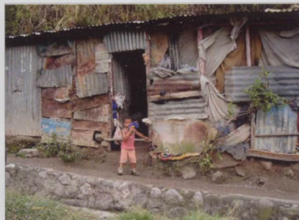
Type de maison qu'on peut rencontrer parfois en République Dominicaine.