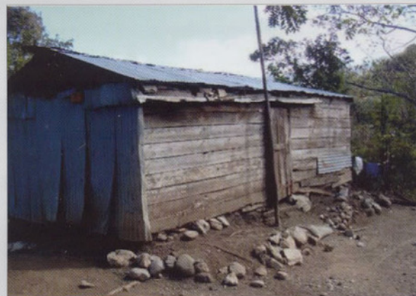
Maison d'une famille pauvre.