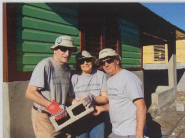
Maison que nous avons construite en République Dominicaine.